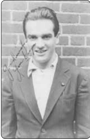
De jonge Krupa.