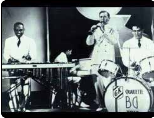
Gene Krupa met o.a. Benny Goodman.

bij Buddy Rogers. Zijn Chicago vrienden hadden hem niet vergeten, want met hen kon hij op 18 april 1932 de opnamestudio in. Onder de noemer Billy Banks and his Rhythmakers werden op 8 april en 23 mei 1932 zes stukken opgenomen, - met Henry 'Red' Allen, Pee Wee Russell, Joe Sullivan, Eddie Condon, Jack Bland en Al Morgan -. Platenproducer John Hammond haalde hem over om bij het pas opgerichte orkest van Benny Goodman te komen. Het was inmiddels 1934 en Goodman had een wekelijks radiocontract met een programma 'Let's Dance'. Radio had in de jaren twintig al bewezen, dat het een belangrijk medium was, maar midden in de 'Depressie' bleek het nog belangrijker te zijn!! Vooral toen het nieuwe orkest van Goodman